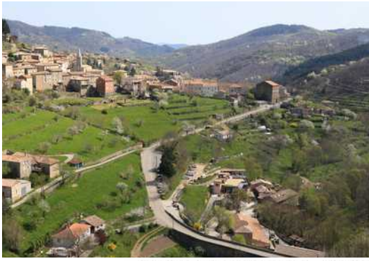
SAINTPIERREVILLE Site de la SCOP Ardelaine